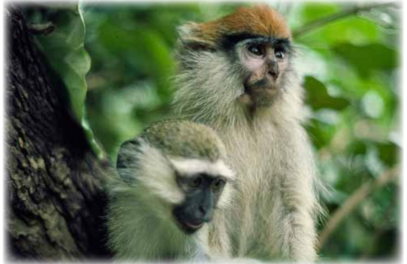
De voor vaccins gebruikte groene aapjes