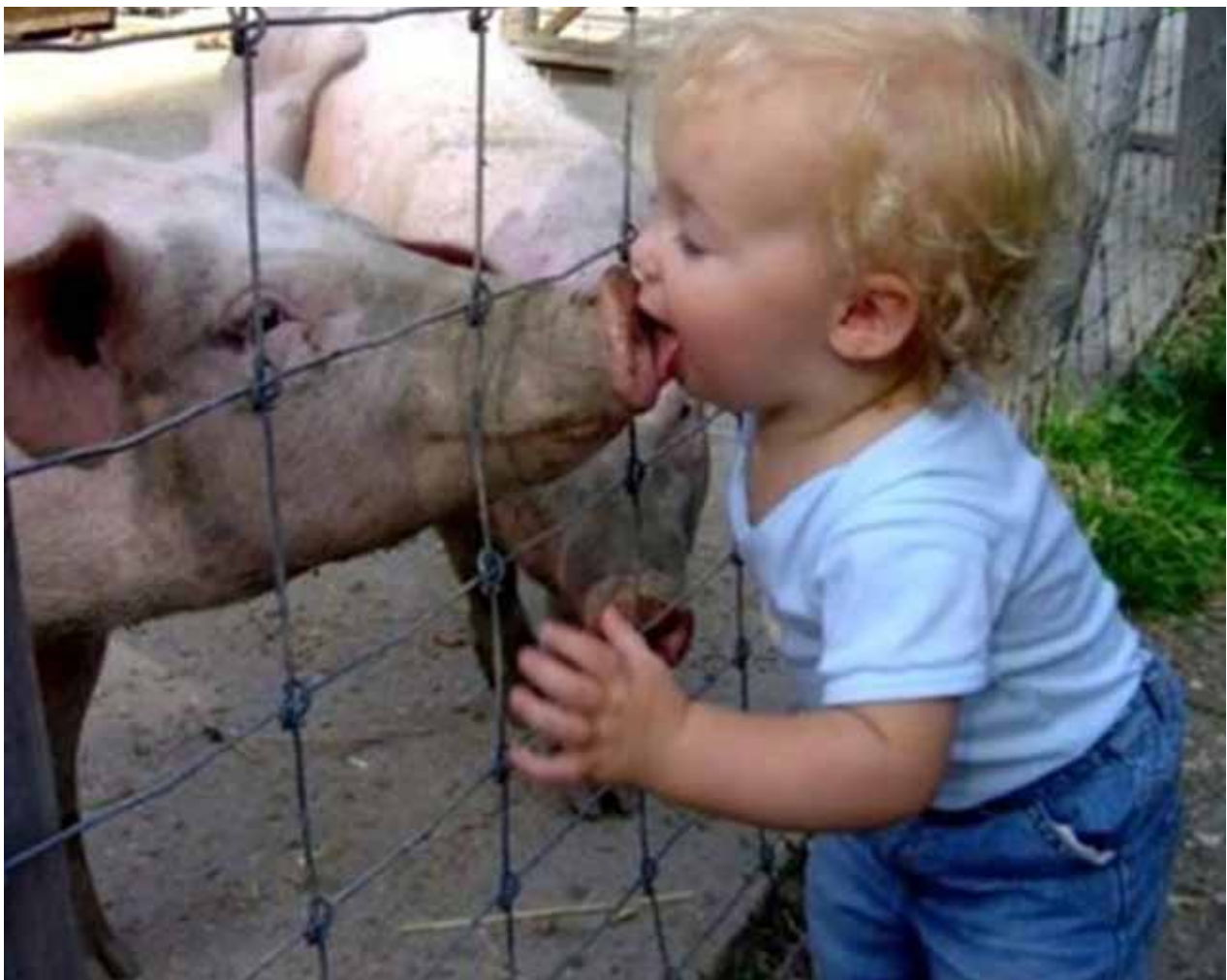
Een "onschuldige" varkenskus

Het lijkt zo absurd om het te hebben over een werelddictatuur en het is ook bijna niet te geloven dat zoiets mogelijk zou zijn, maar ja, dat was, zoals