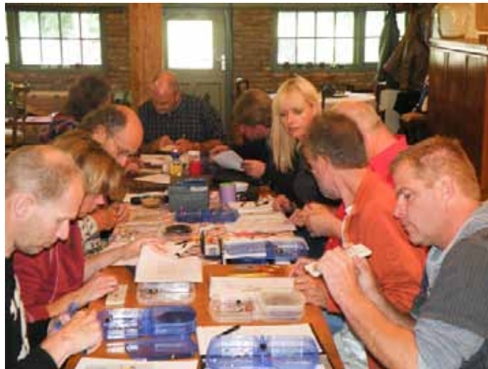
Samen aan het werk tijdens een zappermaakcursus

Wat het varkensgriepvaccin betreft? Wat ik tot nu toe weet (en de inentingscampagne begint volgende week pas!) is: 25 mensen overleden na de vaccinatie in Amerika, 5 in Zweden en een verhaal van een verder gezonde Duitse zakenman die tot een testgroep behoorde, maar bloed begon te spugen na de inenting. Het kan zijn dat de andere overleden personen, zoals gezegd wordt, tot een risicogroep behoorden, maar zijn dat niet juist de mensen die ze het eerst willen inenten en gaat het dan niet om moord met voorkennis als men doorgaat met inenten? In ieder geval is het een keuze die ik niet graag zou maken en ik zou er alles behalve verantwoordelijk voor willen zijn.